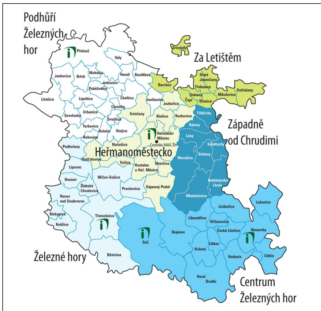
Obrázek 1 Území působnosti MAS Železnohorský region, z.s. s vyznačením hranic obcí

Územní působnost MAS Železnohorský region, z.s. je patrná z následujícího obr. 1 a 2.